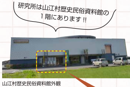
山江村歴史民俗資料館外観